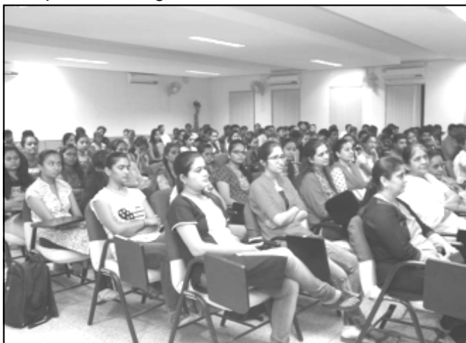
Participants of the Seminar